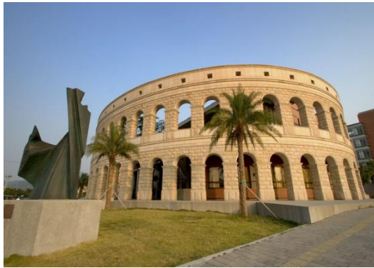
圖 2-1 亞洲大學體育館